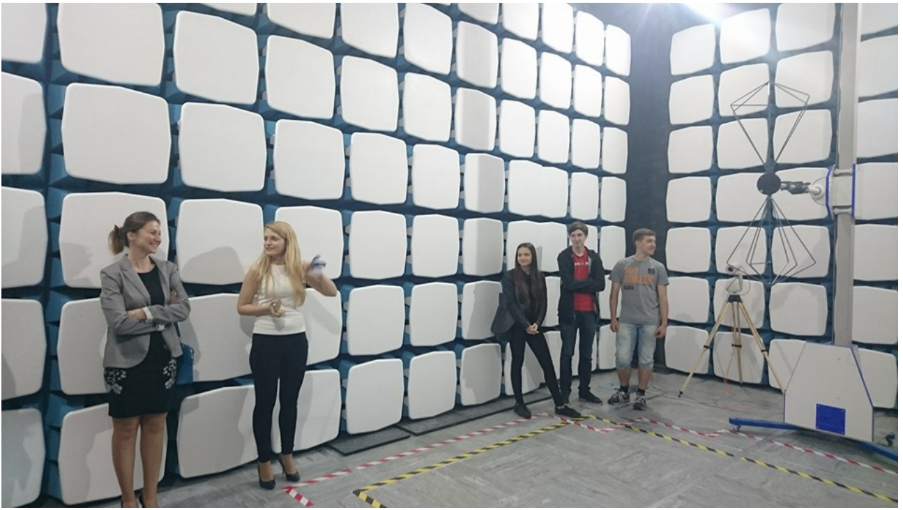
Oprac. Aneta Napierała